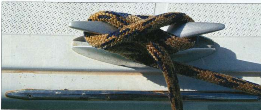
▲ Les aussières sont donc préalablement lovées et frappées sur les taquets du bord.