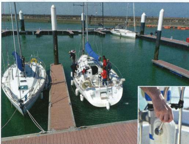
▲ Si vous arrivez avec trop de vitesse, n'hésitez pas à donner un coup de marche avant pour casser l'erre du bateau.