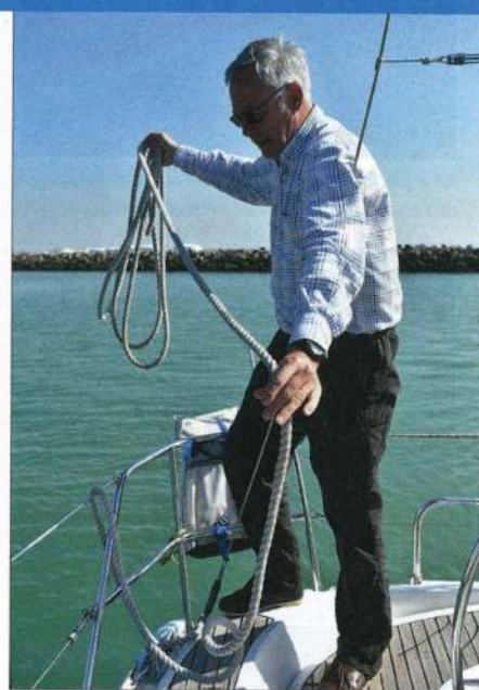
▲ Les aussières aussi sont frappées à l'avant et à l'arrière à l'avance, et lovées pour être au clair.