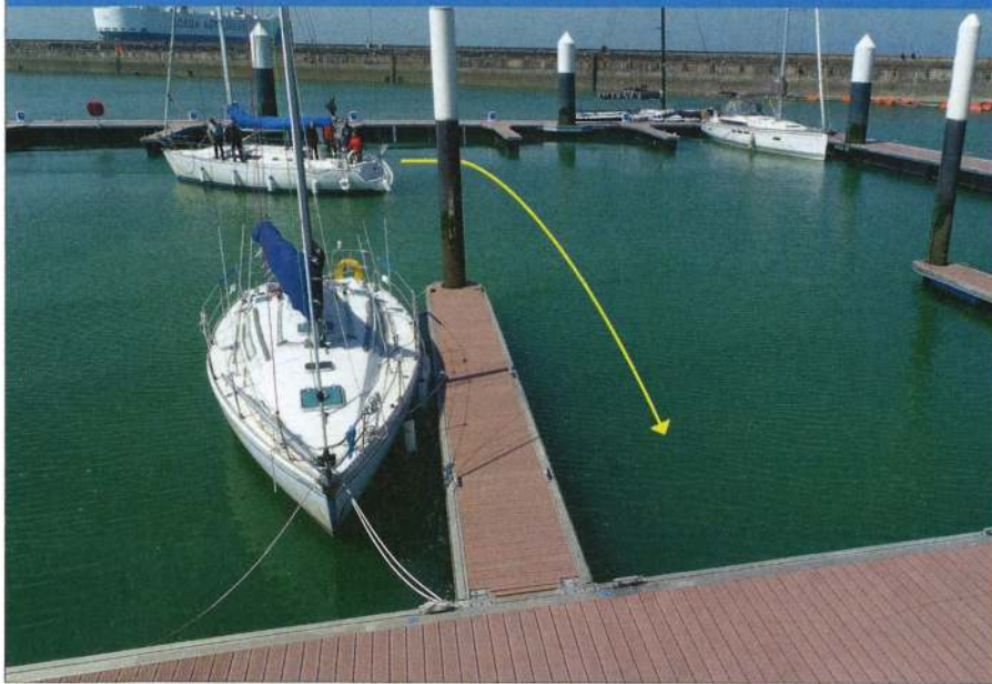
▲ Avec un temps dément et sans vent, nous avons abordé cette place à faible vitesse. Le barreur doit largement enrouler pour aborder sereinement sa place.