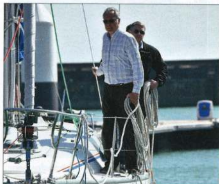
▲ Aussière à la main, les équipiers sont prêts.