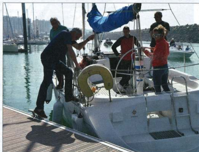
▲ Sur un catway, vous pouvez arriver avec un peu plus d'angle, en prévoyant un pare-battage sur l'arrière.