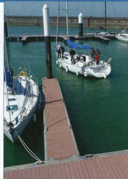
▲ Quand l'arrière arrive au niveau du catway, rétablir la trajectoire et finir sur son erre.