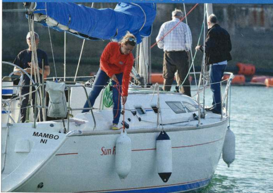
▲ Le ou les équipiers préparent les défenses et ajustent la hauteur en fonction de la place d'accostage. Trois ou quatre pare-battage sur chaque bord, et un équipier avec une défense à la main.